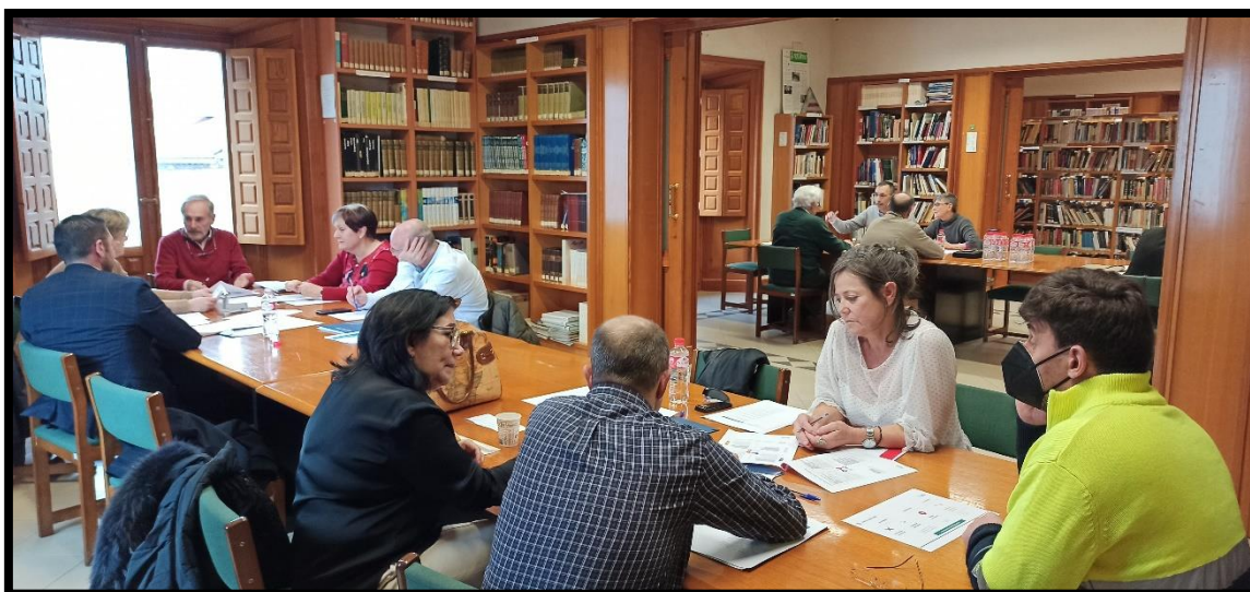
Imagen 1. Fotografía durante la ejecución de la fase 4 del taller de priorización