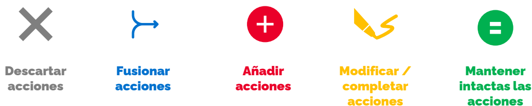
Ilustración 2. Opciones de tareas a aplicar en cada una de las acciones a revisar por los participantes

Respecto a este último objetivo esperado del taller, cabe señalar que se le dedicó buena parte de la sesión, esperando que los inputs de los participantes fuesen fruto de la aplicación de alguna de las siguientes tareas sobre las acciones a revisar: